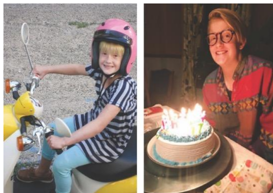
¡Celebrar y disfrutar de la vida!

En el hospital hay personal dedicado a ayudarles con el alojamiento, las cuestiones económicas, la alimentación, cómo alcanzar las metas de las diferentes etapas del desarrollo, y con su bienestar general.